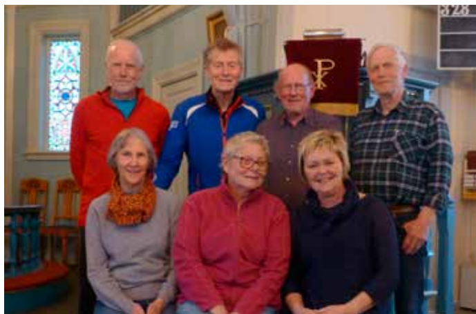
Kapellstyret (ikke ajourført)

Kapellet er privateid, og alle justøyfolk som bryr seg om det, kan regne seg som medeiere. Et årlig valgt styre står ansvarlig for driften.