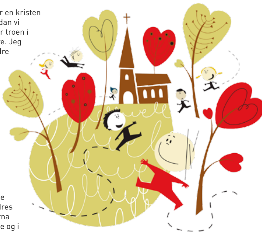
Illustrasjon: E. Moseng

Gunhild Krossnes Trosopplærer Lillesand menighet